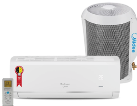
Convencional e Inverter